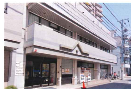
岩井整形外科内科医院