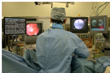
手術映像リアルタイム配信システム(内視鏡手術) 最先端の機器が揃った手術室。モニターに映っている内視鏡手術のビデオは録画されていて、希望患者さんに開示しています。